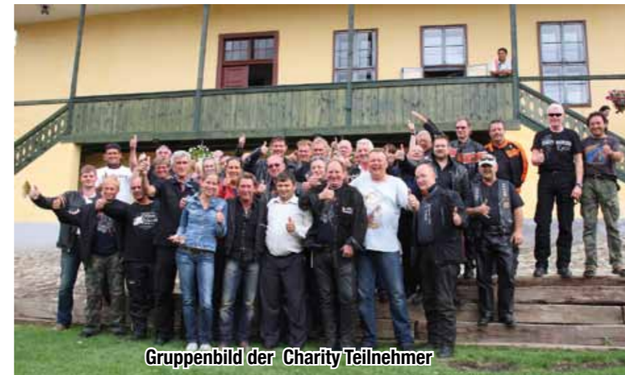
Gruppenbild der Charity Teilnehmer

Von Sibiu aus führte die Reise über Maffays Heimatort Brasov nach Bran und Radeln. Neben extrem kurvigen Traumstraßen wie der Transfogarascher Hochstraße, die auf bis zu 2042 Höhenmetern atemberaubende Ausblicke über die höchsten Berge Rumäniens garantierte, bot auch der Besuch des weltberühmten Dracula Schlosses Bran unvergessliche Momente. Am Ende waren sich alle Teilnehmer einig: Selten war es aufregender, Gutes zu tun. Mehr Infos unter www.petermaffaystiftung.de www.harley-davidson.com